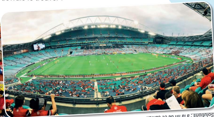
Solutions : à la fin de ce cahier.